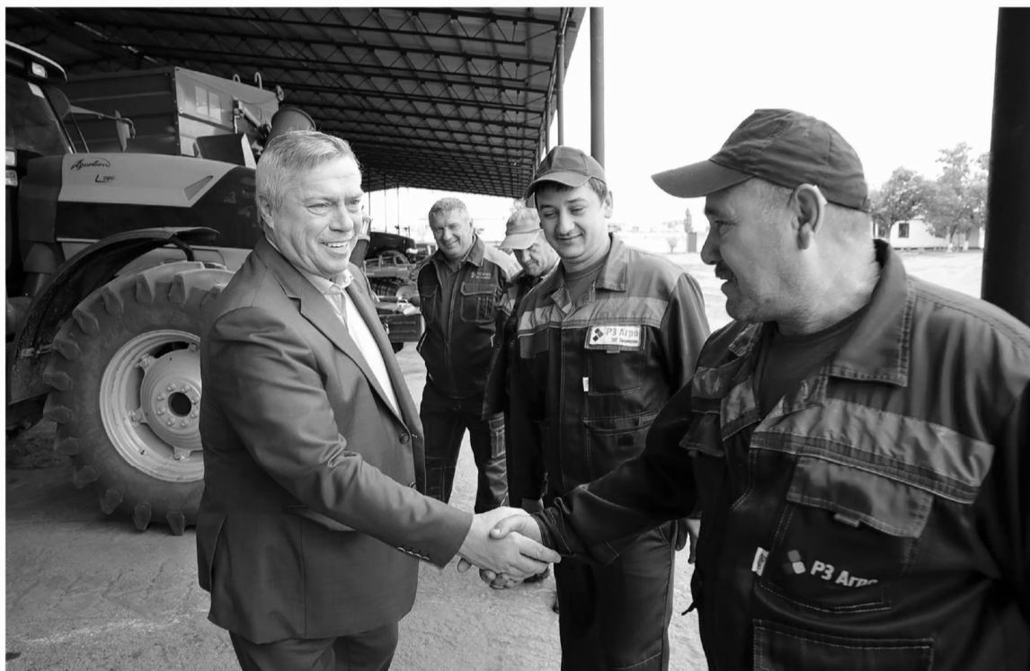
У сельчан нет отпусков – собрав урожай, они готовятся к новому сезону, чтобы обеспечить область и страну хлебом

Однако урожай в Ростовской области очень сильно зависит от погодных условий. Впрочем, сельские безусловно учитывают этот и многие другие факторы, увеличивают объемы вносимых минеральных удобрений, проводят сортовое обновление, постоянно совершенствуют технологии возделывания. А также прислушиваются к ученым – на Дону все шире применяются энерго- и влагосберегающие технологии об-