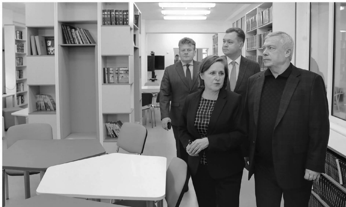
Создание мест в школах, поддержка детских инициатив и движения детей и молодежи «Движение первых» на местах – по мнению губернатора сейчас очень необходимо

работает донское здравоохранение. С 1 января все медицинские организации переданы в областную собственность, однако в этот переходный период они остро нуждаются во внимании местных властей.