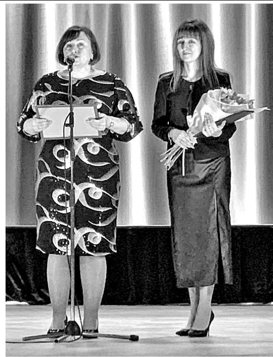
ципального ансамбля казачьей песни "Станица".

Невозможно представить художественную самодеятельность Дома