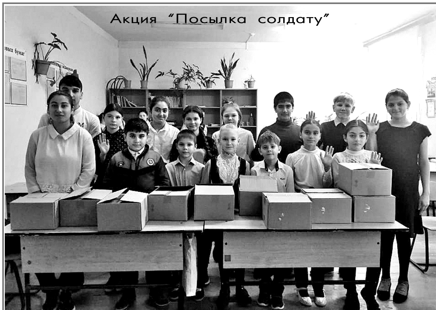
Акция "Посылка солдату"