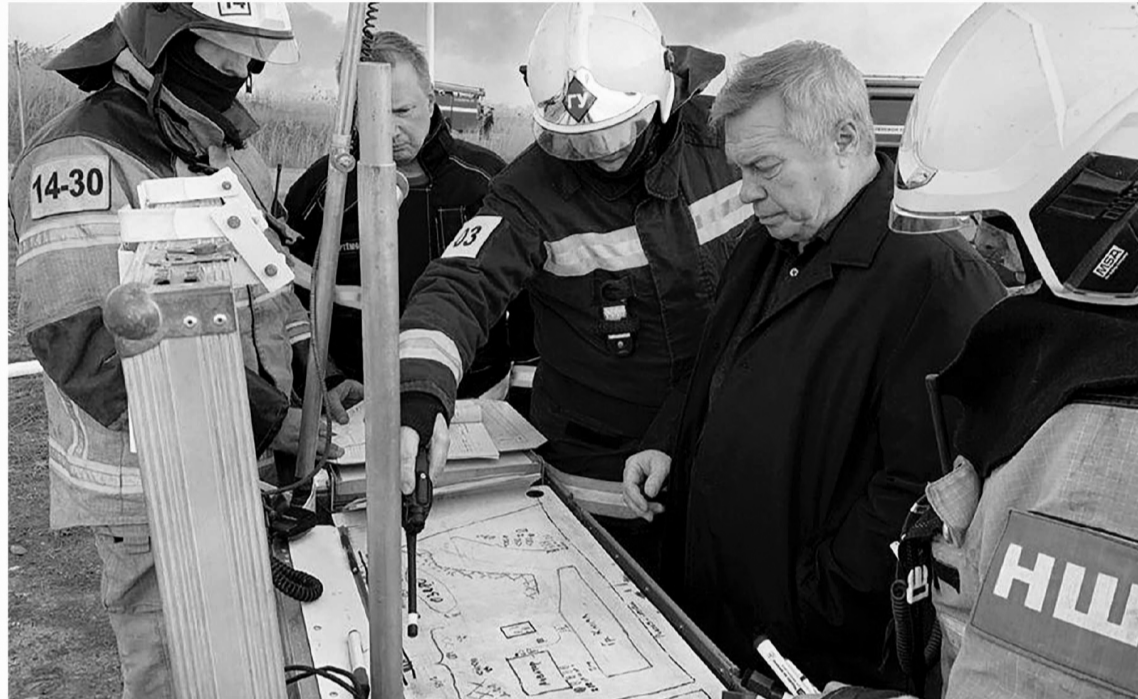
Областная противопожарная служба сейчас работает в усиленном режиме, чтобы защитить жителей региона