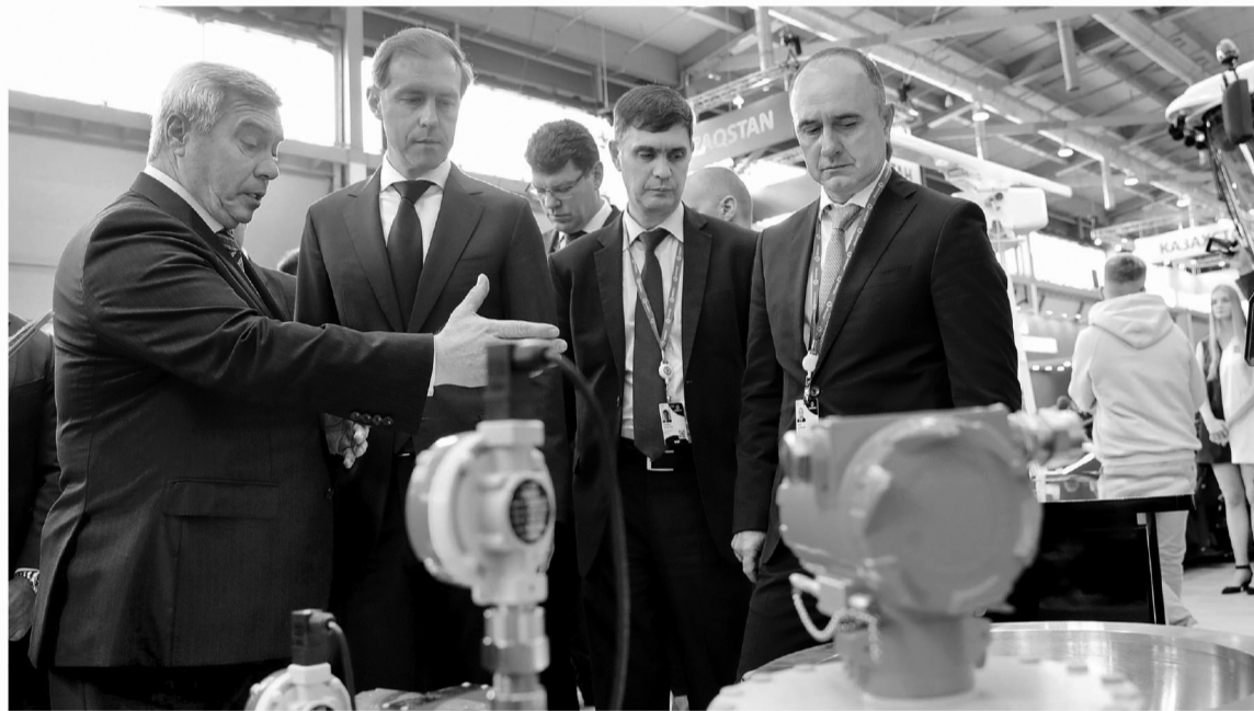
«Иннопром-2022» открыл для Ростовской области новые перспективы развития

Больше десятка соглашений с акцентом на импортозамещение и общим объемом инвестиций более чем 31 млрд рублей, развитие новых сфер и укрепление уже имеющихся позиций – таковы результаты участия Ростовской области в международной промышленной выставке «Иннопром-2022».