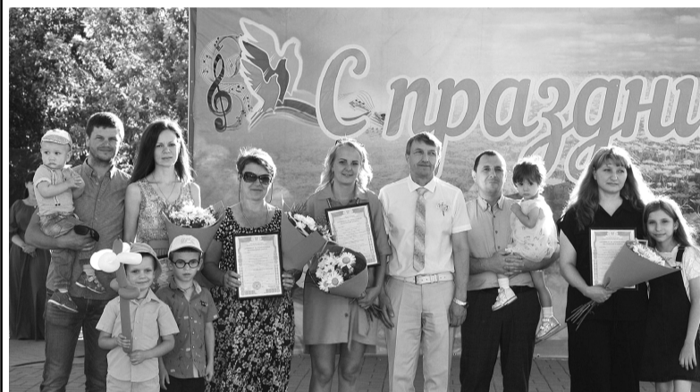
На праздник пришли семьи, в основном, в полном составе. Шесть молодых многодетных семей Волгодонско-