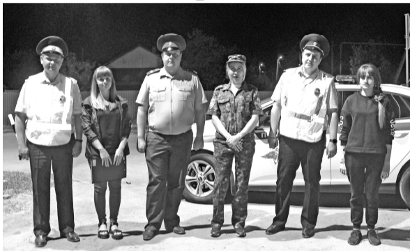
Уважаемые жители Волгодонского района, родители (законные представители) несовершеннолетних!

В результате проведённых рейдов членами межведомственной рабочей группы фактов нахождения несовершеннолетних граждан в ночное время суток (после 22.00 часов) без сопровождения родителей (законных представителей) не выявлено.