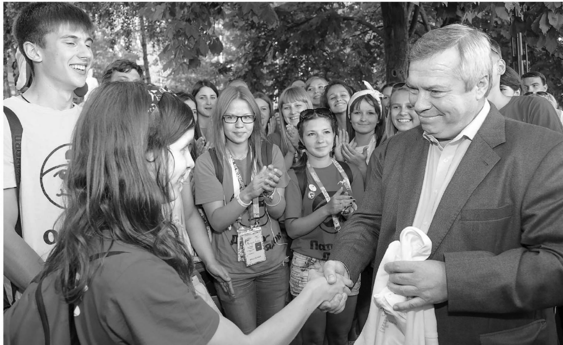
Лето-2022 позволит отдохнуть детям разных возрастов с учетом их интересов и особенностей

За счет бюджета в оздоровительные лагеря Неклиновского, Миллеровского, Семикаракорского, Тарасовского и других районов области уже закуплены путевки для детей, находящиеся в трудной жизненной ситуации. Но поддержку получают все семьи – за самостоятельно приобретенную путевку родители смогут компенсировать до 100% ее стоимости. Эта мера под-