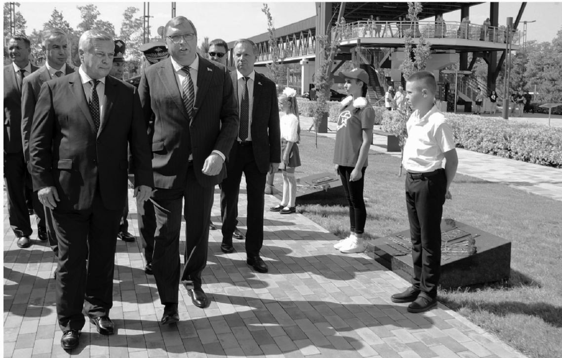
Работа по сохранению памяти в Ростовской области продолжается, сейчас – это имеет особое значение

– Аллея воинской славы и доблести послужит сохранению памяти о великом подвиге нашего народа. И напомнит, с кем сражались наши деды и прадеды. Два города