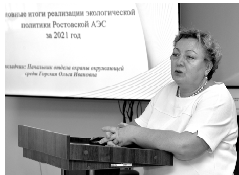
новые итоги реализации экологической политики Ростовской АЭС за 2021 год

Кроме того, для борьбы с зарастанием водоёма-охладителя атомщики регулярно заселяют его акваторию рыбой травоядных пород. В прошлом году в водоём выпущено более 3 тонн толстолобика, 3