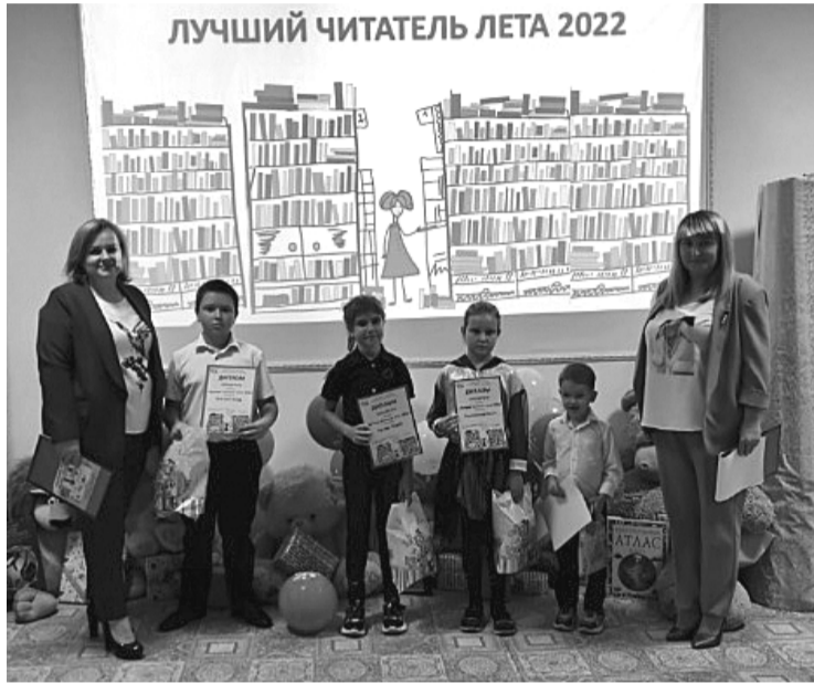
ЛУЧШИЙ ЧИТАТЕЛЬ ЛЕТА 2022

День рождения есть у каждого человека. Но дни рождения бывают и у библиотек. В этом году детской библиотеке в станице Романовская, а ныне Романовскому детскому отделу, исполнилось 65 лет! Памятную дату можно отмечать по-разному: греметь фанфарами и пускать в небо фейерверки, или же в кругу друзей вспомнить, как всё начиналось, поделиться тем, что было хорошего за эти годы, помянуть о будущем и просто порадоваться тому, что есть!