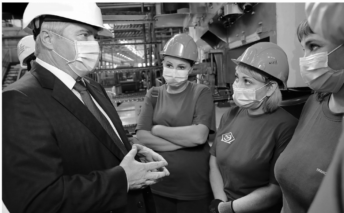
В первую очередь правительство области сохранит все социальные гарантии и защитит человека труда

На данный момент ситуация контролируемая: имеются достаточные запасы продовольствия, горюче-смазочных материалов, донской АПК полностью готов к весенне-полевым работам — все ведомства губернатору отчитались. Отслеживать малейшие колебания планируется постоянно, с еженедельным анализом.