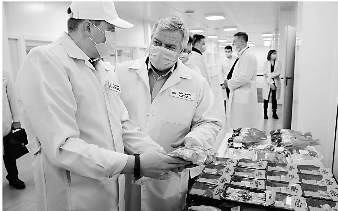
Инвестпроекты «губернаторской сотни» получают особую поддержку от правительства региона

Инвестиционная декларация была утверждена на Дону еще в 2013 году. И функции инвестиционного комитета выполняет совет по инвестициям при губернаторе, регулярно рассматривается ход реализации проектов, оперативно