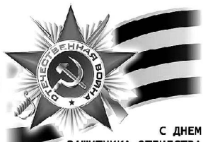
С ДНЕМ ЗАЩИТНИКА ОТЕЧЕСТВА

Политсовет местного отделения партии "Единая Россия"