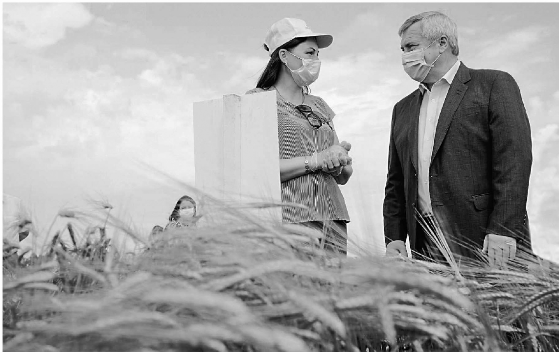
Глава региона Василий Голубев уверен, что новый рекорд аграриев в год 85-летия Ростовской области стал бы всем хорошим подарком

Донской минсельхозпрод отмечает, что ежегодно увеличиваются объемы внесенных минеральных удобрений, проводится сортообновление и сортовое обновление, совершенствуются техноло-