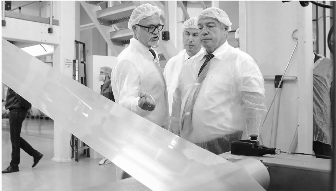
Предприятия региона осваивают новые ниши и укрепляют свои позиции на отечественном рынке

– Мы сами – а федеральный центр нас поддерживает – субсидируем закупку элитных семян отечественной селекции, – говорит губернатор. – Задача семеноводов – заместить освободившуюся нишу зарубежных производителей, работа в этом направлении ведется.