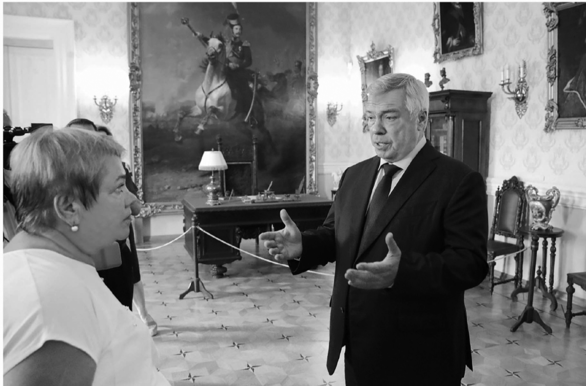
С уникальным историческим наследием казачьего прошлого смогут познакомиться еще больше людей

Министерство культуры такие расчеты в отношении своих пяти средних учебных заведений уже сделало, минздрав и департамент