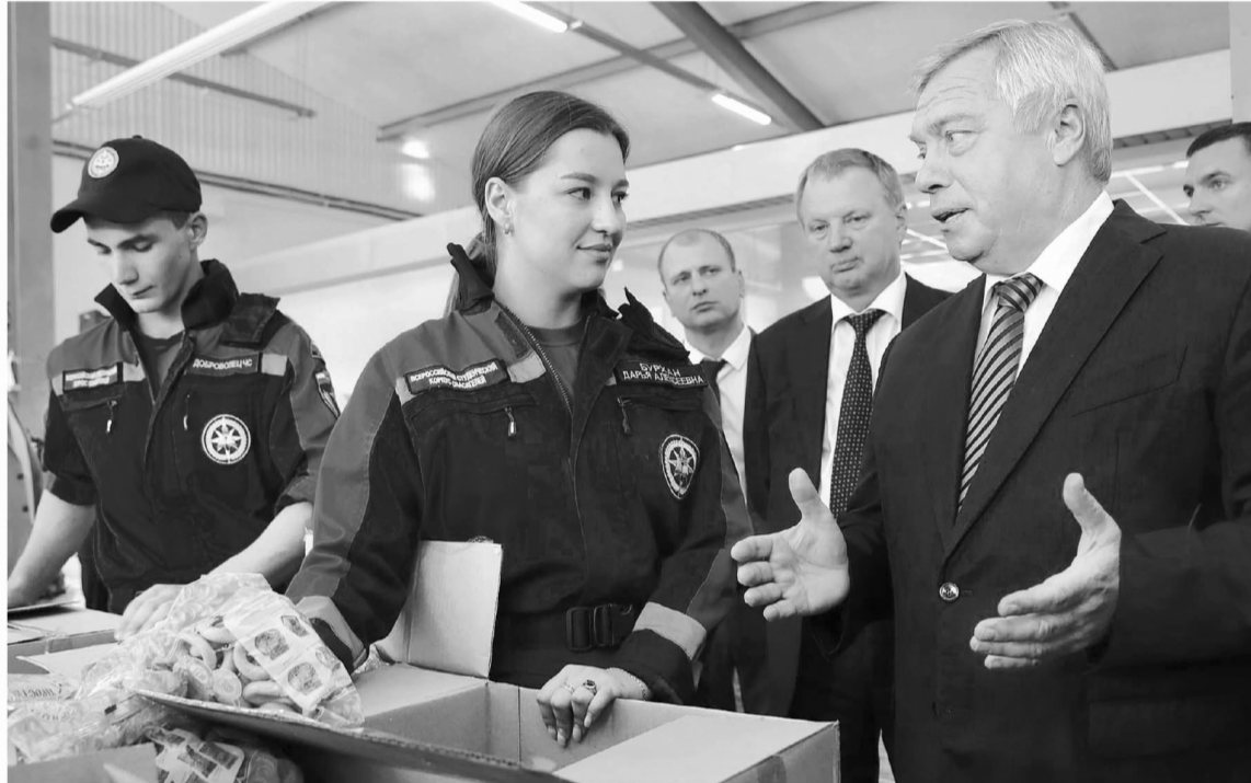
Проекты, реально помогающие людям, должны получать всестороннюю поддержку властей всех уровней

– Но этого все равно мало. Необходимо возводить их в каждой территории, и не по одной! Руководителям муниципальных образований не стоит ждать, что финансовые средства поступят сверху, это плохая позиция. Надо поработать с бизнесом. Посмотрите, как это востребовано, людям надо создать максимальные условия для занятий, – подчеркнул губернатор и поручил представить до конца первого квартала предложения по созданию дополни-