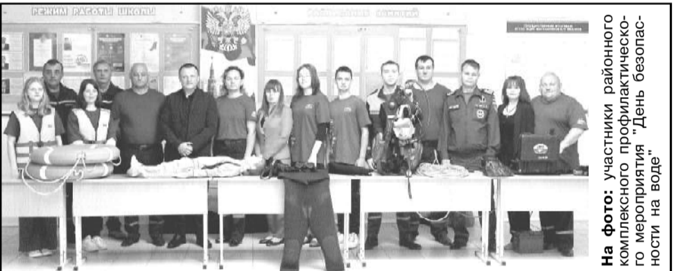
На фото: участники районного комплексного профилактического мероприятия "День безопасности на воде"

Доверяйте свое здоровье профессионалам! Реклама. ВОЗМОЖНЫ ПРОТИВОПОКАЗАНИЯ. ПРОКОНСУЛЬТИРУЙТЕСЬ СО СПЕЦИАЛИСТОМ.