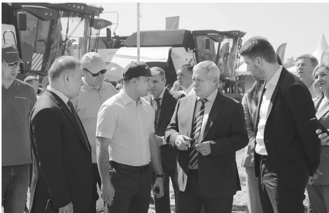
Ростовская область практически готова начать битву за урожай-2023

Самый большой парк сельхозтехники в стране сегодня, как из-