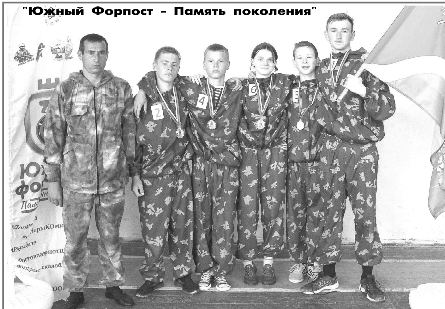
"Южный Форпост - Память поколения"