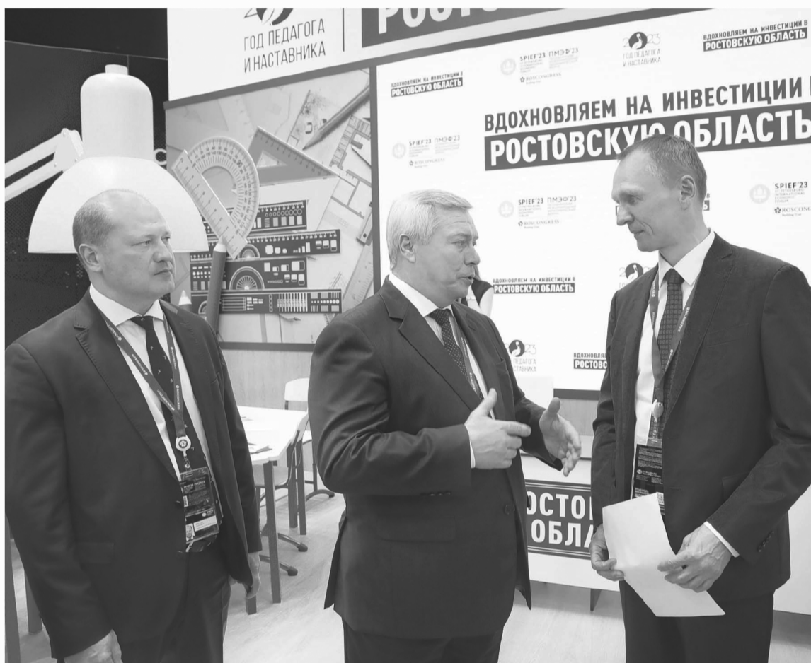
Все инвесторы в Ростовской области получают необходимую поддержку правительства

– Ранее мы это обсуждали, нашли решение. Сделаем так, чтобы обеспечение коммуникациями было синхронизировано. Такой