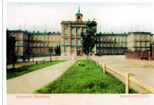
Мариинский Институт. НОВОЧЕРКАССКЪ