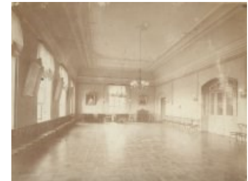
Бальная зала училища

В 1917 году в России были отменены сословия, поэтому весной 1918-го институт стал именоваться Мариинским Донским институтом.