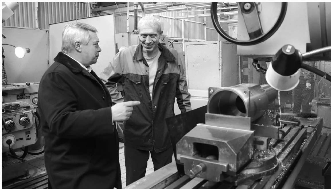
На санкции донская экономика реагирует импортозамещением и ростом производства в разных сферах

но была направлена на поддержку уязвимых категорий граждан.