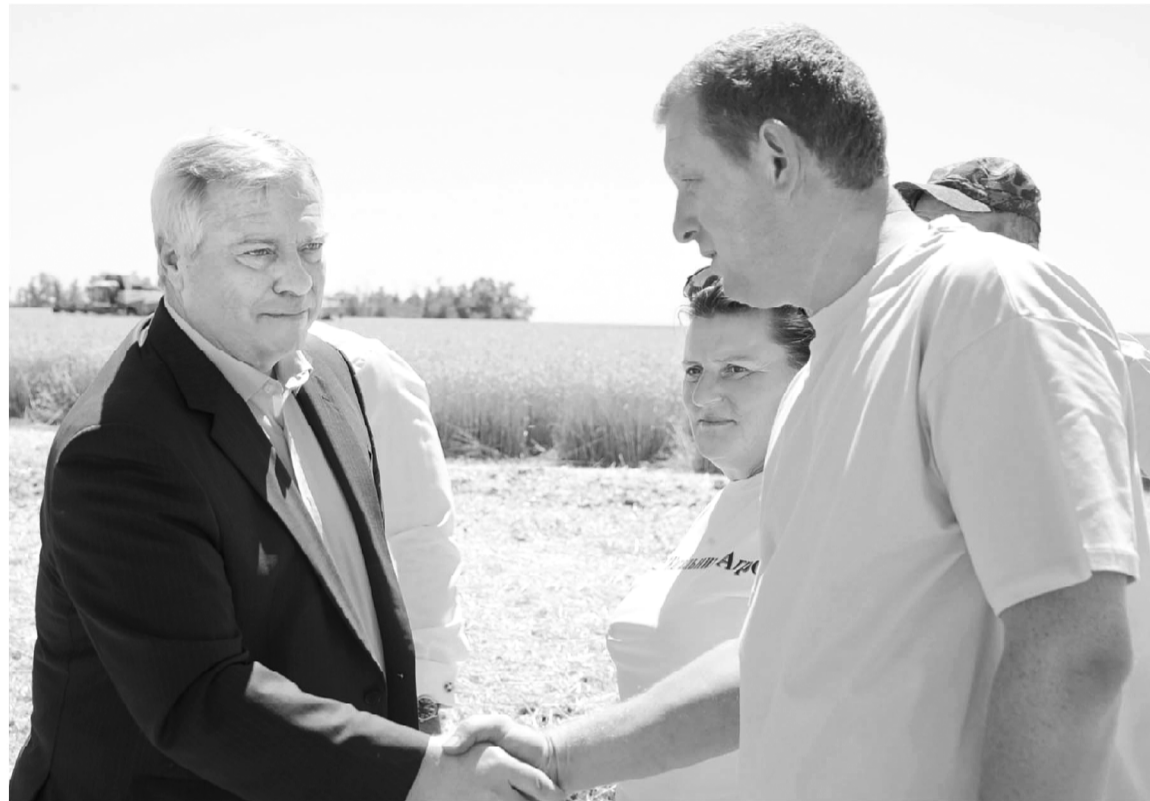
Для донских аграриев настала самая горячая и ответственная пора

Техническая готовность – важнейшая составляющая своевременной и эффективной уборки урожая, именно поэтому правительство области уделяет большое внимание вопросам модернизации парка сельхозмашин. За последние пять лет в регионе приобретено 2,4 тысячи зерноуборочных комбайнов, что позволило на 6% снизить нагрузку на каждую машину. В этом году на субсидии для приобретения новой сельхозтехники из областного бюджета