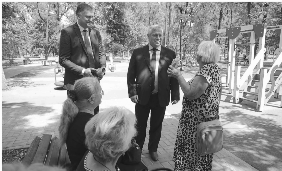
Василий Голубев уверен, что социальные службы должны учитывать все потребности людей, нуждающихся в их помощи

Система социального обслуживания населения в Ростовской области за последние годы заметно изменилась. Если раньше услуги оказывались только на базе стационарных учреждений, то теперь стараются сохранять привычную и комфортную среду для получателя услуг. Тут на помощь может прийти «Школа по уходу», уже действующая на базе 32 центров социального обслуживания пожилых и инвалидов. «Школа» позволяет родственникам получить знания об общем уходе, нюансах питания, основах реабилитации. Специалисты рассказывают и, что важно, показывают, как и что нужно делать, как использовать технические средства реабилитации, консультируют и поддерживают моральный дух. Каждый год «Школу по уходу»