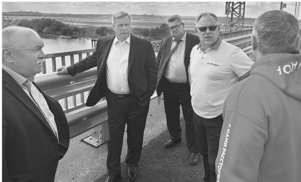
Дороги области – это не только ежедневная необходимость, но вклад в будущее региона

Однако дорожные вопросы по-прежнему остаются самыми популярными среди обращений граждан к главе региона, поэтому важно постоянно корректировать уже существующие планы и вырабо-