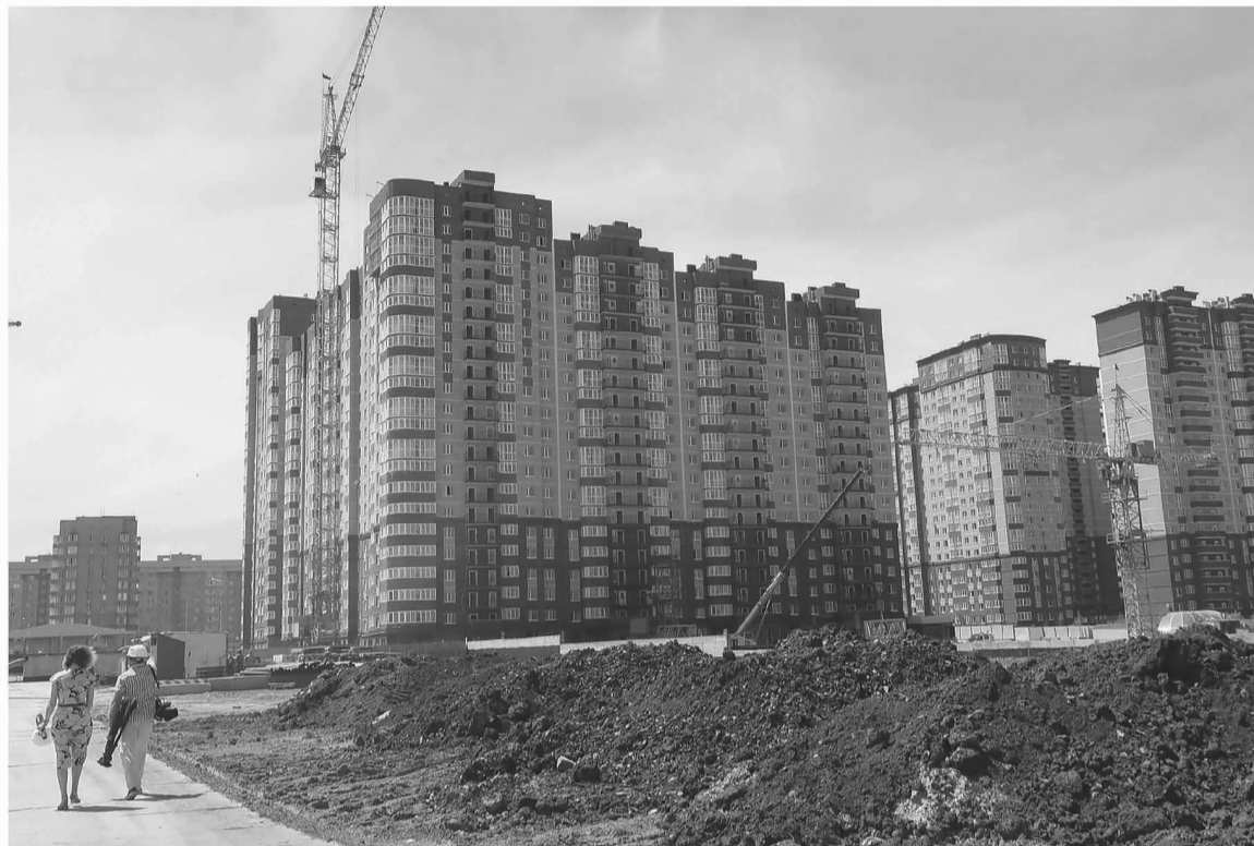
Новые квартиры жильцы расселяемых аварийных домов получают в том числе и в новостройках

и городская среда» в текущем году переселено 814 человек из 13,5 тысячи квадратных метров аварийного фонда. Также в регионе идет расселение фонда, признанного аварийным с 2017 года. Годовой план – переселить 819 человек из 15,6 тысячи квадратных метров.