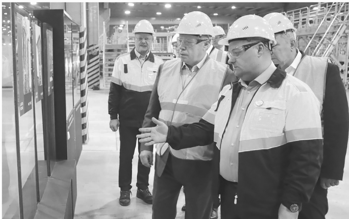
Продукция донских предприятий востребована и в других регионах, и в дружественных странах

эксплуатацию новый комплекс по выпуску субстратов из каменной ваты для тепличных хозяйств. Материалы займут 15% российского рынка. Стоимость проекта составила почти полмиллиарда рублей, выполнен он был в сжатые сроки.