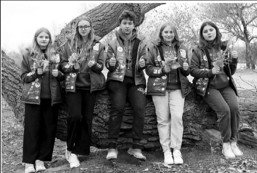
Наступившая осень балует нас не только тёплой погодой, но и разнообразием мероприятий, добрых дел и проектов. А если совместить эти два направления воедино, мы получим новый проект от команды ДонМолодой и научного сообщества донского региона.