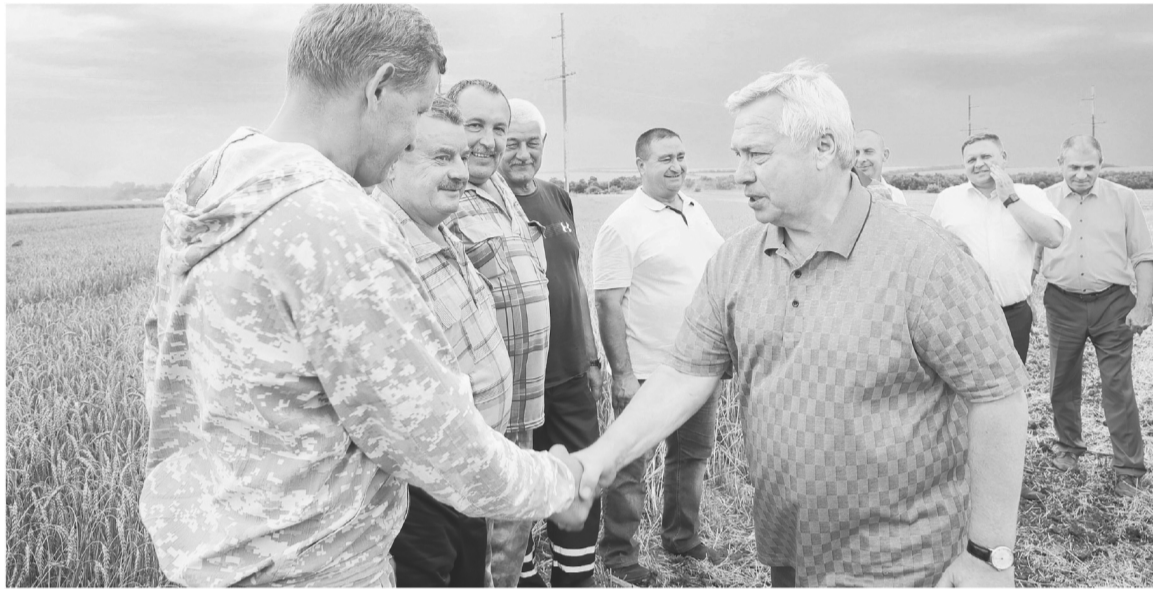
Несмотря на неблагоприятные погодные условия, донские сельчане собрали достойный урожай

– Упорный труд сельчан, опыт, грамотная подготовка к каждому сезону, – подчеркивает губернатор, – все это позволяет Ростовской области уже несколько лет подряд