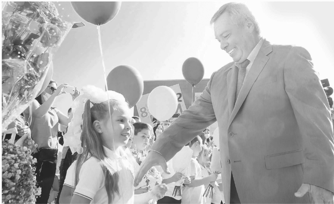
Новые подходы в обучении помогут детям не просто получать общие знания, но и определиться с будущей профессией

Глава региона рассказал, что ремонт был выполнен в 335 объек-