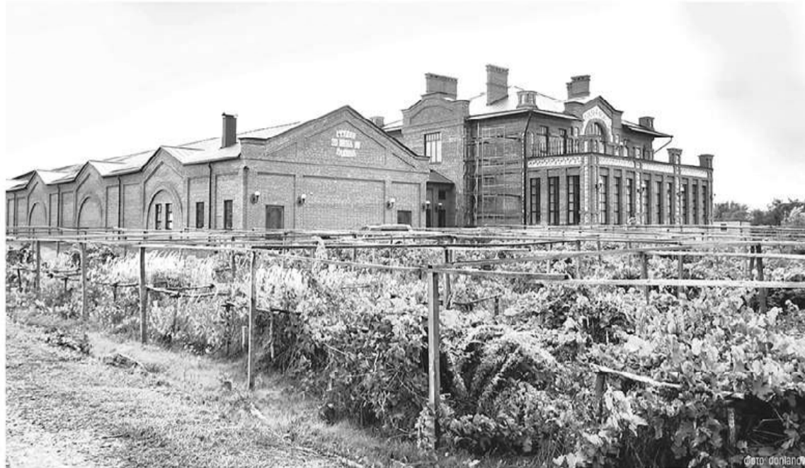
Для агротуризма на Дону развивается комфортная инфраструктура

На днях были подведены итоги отбора проектов на развитие сельского туризма для получения средств господдержки в 2025 году. Заявка Ростовской области из трех проектов на общую