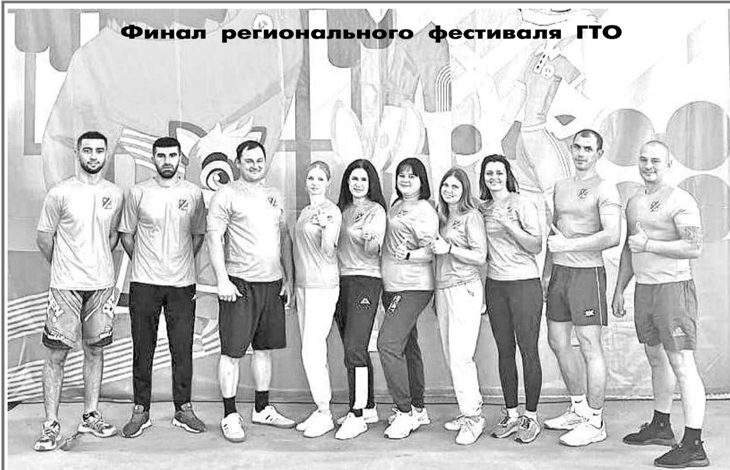
Финал регионального фестиваля ГТО