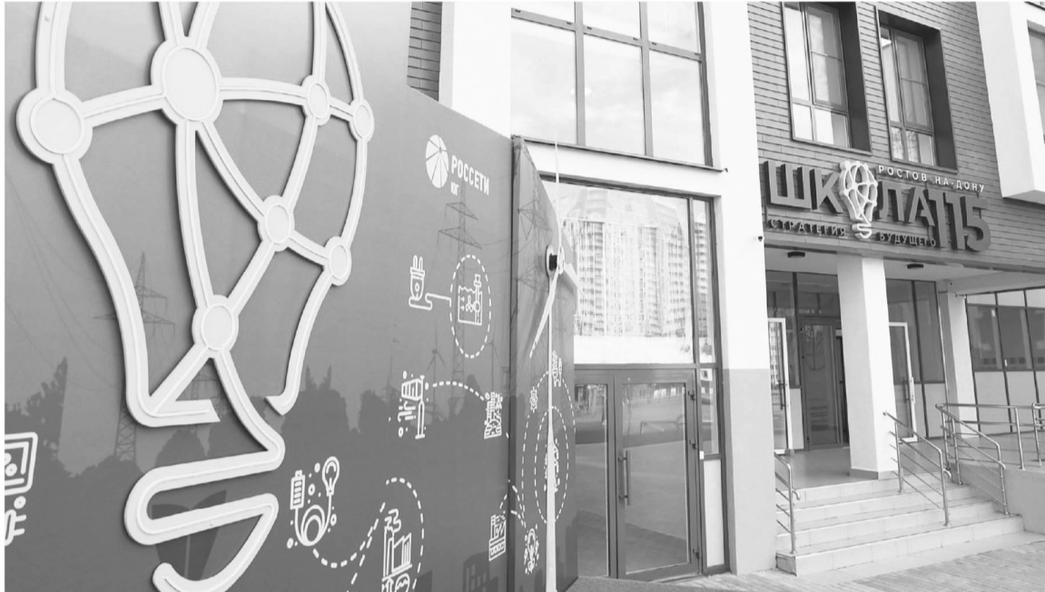
Система образования области пополняется современными школами

Также в этом году в Ростовской области должен завершиться капремонт 43 школ. Более 700 учреждений образования оснастят оборудованием для занятий по новым дисциплинам – «Охрана безопасности и защиты Родины» и «Труд».