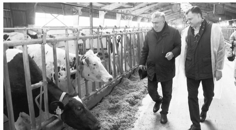
Глава региона ознакомился с работой местного предприятия