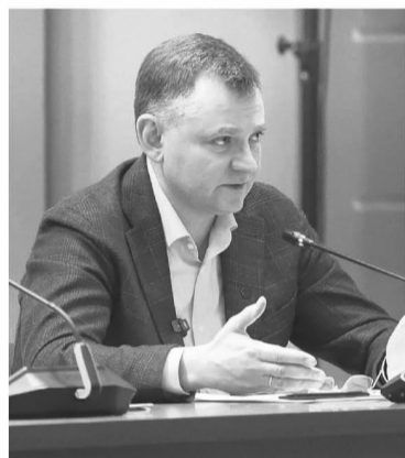
Встреча с жителями района – важнейший пункт программы рабочего визита