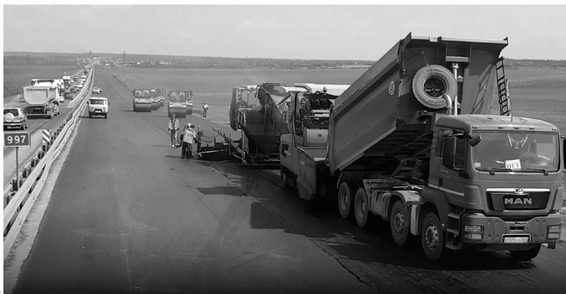
Работы на трассе уже начались