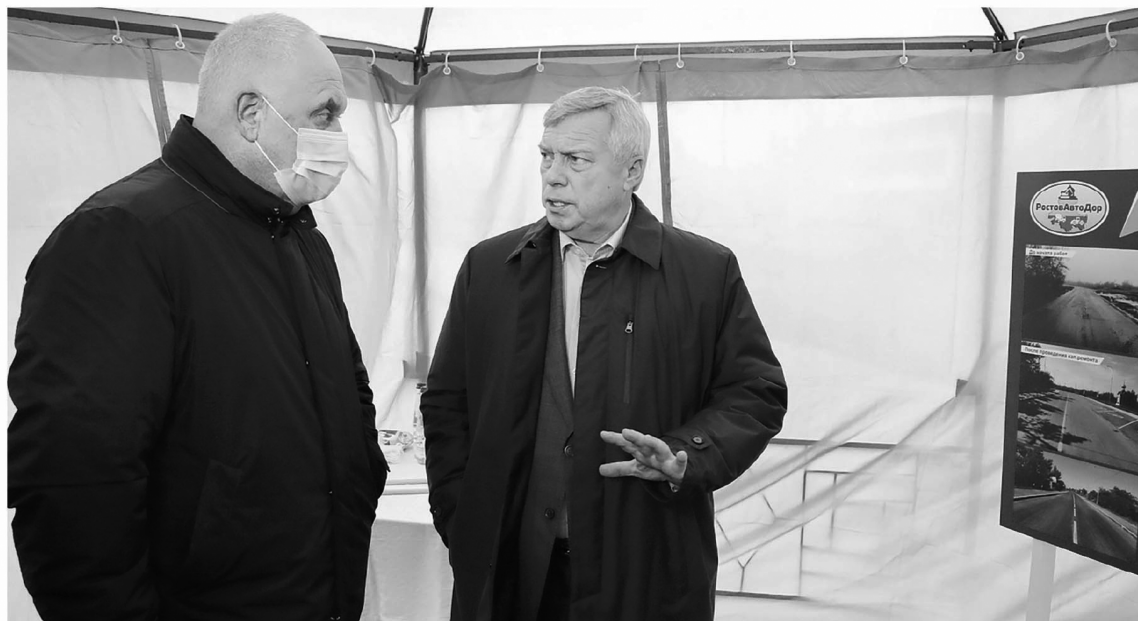
Дороги, жилье, ЖКХ – всегда во главе списка приоритетов правительства области