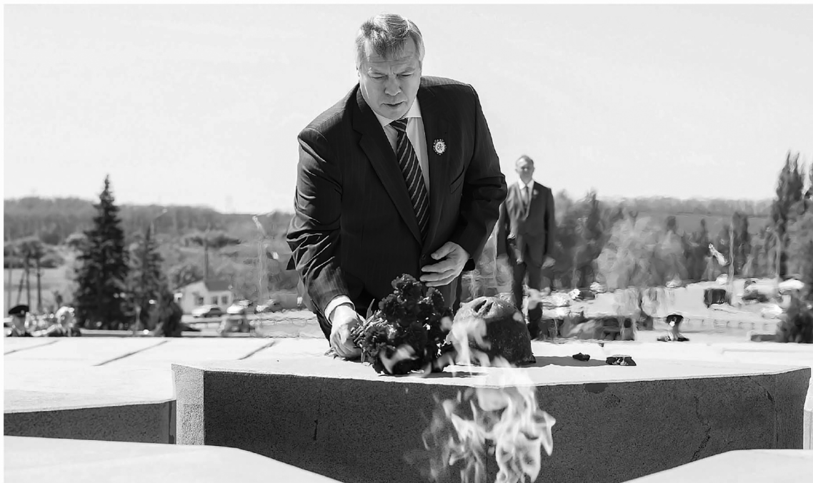
Каждая семья области хранит вечный огонь памяти о своих воинах

Многие победы целиком зависели от стойкости и героизма